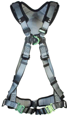
V-FIT, Rücken- und Brust-D-Ringe (Teilenummer 10206534)