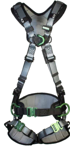
V-FIT, Rücken-, Brust-D-Ringe und seitliche Halteösen mit Haltegurt (Teilenummer 10206546)